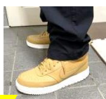
「いい買い物できました！」