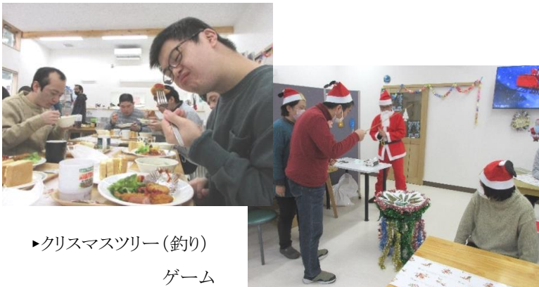
▶クリスマスツリー(釣り) ゲーム

クリスマスランチを頂く前に職員からクリスマスと言えば…と質問したところ「サンタさん!」と答えていた人がほとんどでした。その流れでクリスマスの由来についてYoutubeを見ました。クリスマスランチは「おいしい!」とみんな完食。午後からは、【クリスマスツリー(釣り)ゲーム】を行いました。いつもの活動でも行っている魚釣りのクリスマスバージョンです。クリスマスツリーの絵の裏にお菓子の写真が貼っており釣れるまで何が出るかわからなくドキドキ。さて何が釣れたかは丸木橋のみんなに聞いてみてくださいね。最後は、クリスマスケーキを食べ笑顔が絶えない丸木橋のクリスマス会でした。