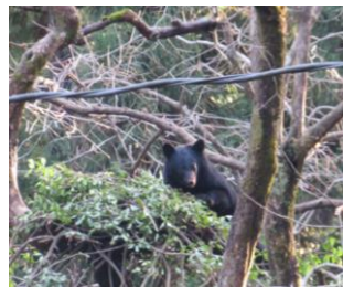
◀エサを求めて数日通ってきたクマ

新型コロナウイルスも5類に移行しやっと少し落ち着いてきたと思った矢先、今年の夏の記録的大雨、猛暑、そして全国的に有名になってしまった秋田での過去最多のクマ被害。12月に入ってから、杉の木園すぐ前の柿の木にエサを求めてクマが現れました。爆竹の音にびくともしないクマに「熊鈴」の効き目などもあるはずもなく…。来年は大きな災害もなく、穏やかな1年であってほしいと願うばかりです。そして、来年はどうか山の木の実が豊富でありますように…。