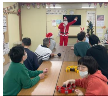
ワンメモリーサンタの登場

クリスマス会恒例となっている合唱。今年は「サンタがまちにやってくる」と「ホワイト・クリスマス」をみんなで歌いました。合唱の後は「わたしはだ〜れゲーム(クリスマス ver.)」を行ない、お昼には、おいしいクリスマスメニューを、午後にケーキとシャンメリーで今年も楽しい・おいしいクリスマス会を行なうことができました。