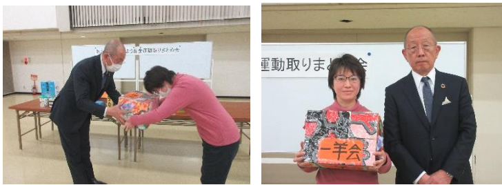
一羊会利用者自治会会長が代表してお届けしました。

なお、詳細につきましては秋田県共同募金会のホームページにも掲載されておりますのでご覧ください。