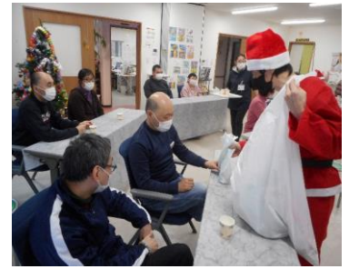
マジックショーやプレゼント、クリスマスランチで大満足 😊