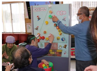
▶ストリームグループ 「カラーボールで キラキラツリー」