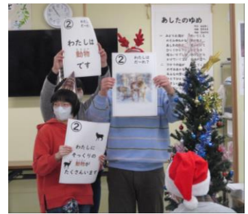
ゲーム「わたしはだ〜れ」