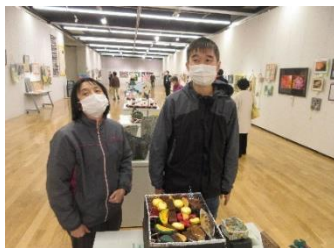
～とうふ屋丸木橋六兵衛～