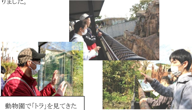
動物園で「トラ」を見てきた