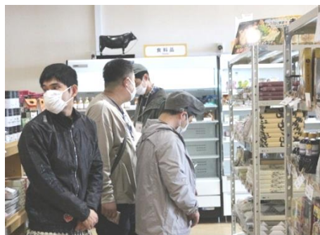
お弁当おいしかった お母さんにお土産買った