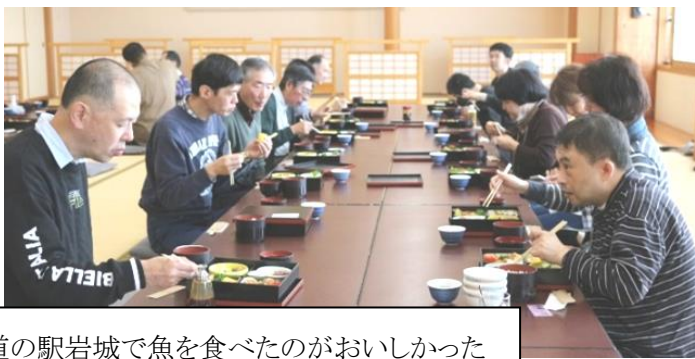
道の駅岩城で魚を食べたのがおいしかった