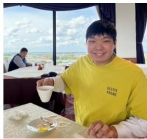
▲ 絶景と料理を堪能♪ ▲