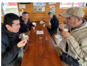
▲甘くておいしかった👉