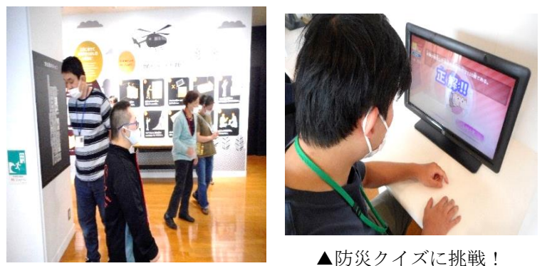
▲防災クイズに挑戦！

暑さも和らぎ心地よい秋晴れの中、明日葉では岩城にある防災学習館へ行ってきました。 係の方より、説明を受けながら煙・初期消火体験を行ない、防災について正しい知識や対処法を学びました。みなさんは「もしも…」の時の備えは大丈夫ですか…。