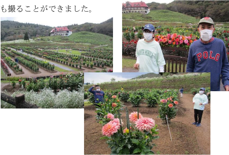
▲撮影スポットで ハイ、チーズ📷

雄和のダリア園が11月5日まで営業しており、見学に行きました。様々な種類のダリアが咲き誇り、平日でしたが、他にもたくさんの方が楽しんでいました。撮影スポットが数カ所設置されており、広い敷地の中をゆっくり見て回り、素敵な写真も撮ることができました。