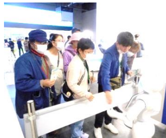
▲ペッパーに挨拶中

10月12日(木)明日葉では海沿いドライブを楽しみながら、仁賀保方面へ日帰り旅行に出掛けました。最初は「白瀬南極体験記念館」で、白瀬轟の壮大な夢とロマンに共感し、南極を学び、オーロラの不思議に触れました。次は「TDK歴史未来館」へ。近代的な建物に吸い込まれるように中へ入るとロボットのペッパーがお出迎え！歴史ゾーンでは古き良き時代を楽しみました。続いて未来ゾーンへ。チームラボによる体験型シアターが利用者みなさんに人気がありました。昼食はエクセルキクスイ「レストラン万葉」で特製万葉御膳を美味しく頂きました。午後は「ハーブワールドAKITA」で石けん作りを体験し、のんびり散策。一日中満喫した楽しい旅行となりました。