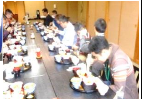
▲みんなで、いただきます😊