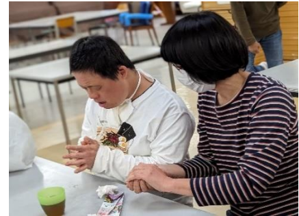
▲真剣ににぎってます👌