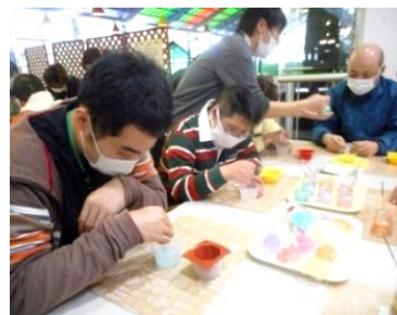
▲石けん作りに夢中！！