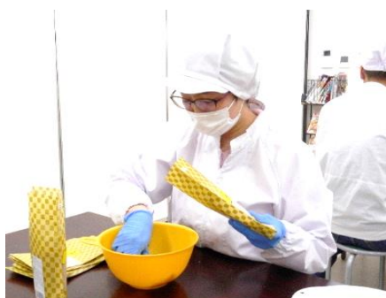
▲ラスクの袋詰め作業中