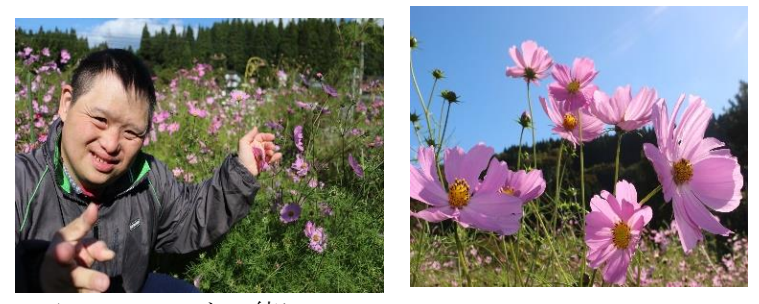
▲ コスモスと一緒に📷

最近、大雨やクマの出現で「いいことないなあ」と利用者は塞ぎ込みがち。そんなブルーな気持ちをハッピーなピンクにすべく、希望者数名で GH 風和里へコスモスを見に出かけました。鮮やかなピンクに魅了されたメンバーは花の摘み取りも！幸せな気持ちをピンクの花束に乗せて、杉の木園へ持ち帰り、ホールを彩りました🌸