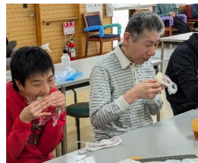
▲おいしく頂きました😊