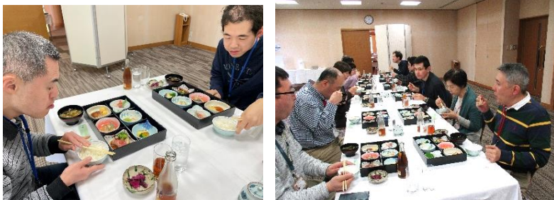
▲ 豪華ランチはみんな完食！！▲

One memory/memory グループの日帰り事業所旅行は、由利本荘市とにかほ市方面へ。昼食は『ホテルフォresta鳥海』の豪華ランチを堪能。その後、土田牧場へ向かい、動物たちとふれあい、ジャージーソフトクリームを味わい、一日ゆっくりと過ごしリフレッシュすることができました。今回の旅行の楽しみを噛みしめながら、これからもたくさんの「楽しみ」を作っていけるようにみんなで様々なことに取り組んでいきたいと思えます。