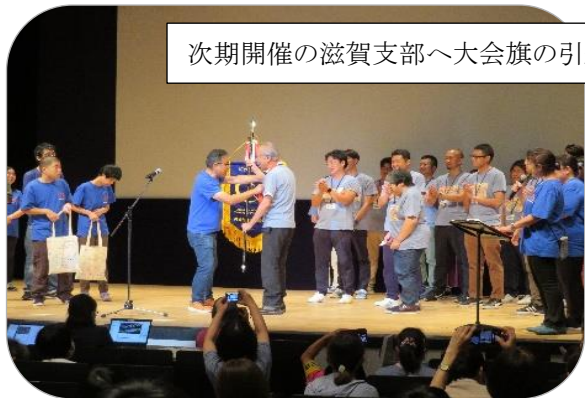
次期開催の滋賀支部へ大会旗の引継ぎ

最後に来年度開催県への引継ぎ式を行い、全ての日程を終了しました。コロナの感染もなく無事に終え、大会開催県の埼玉支部のみなさん大変お疲れ様でした。