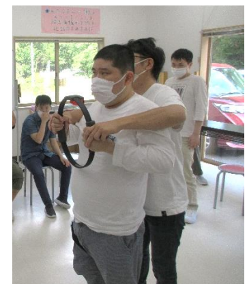
▲レクリエーション 職員と一緒にeスポーツ中!