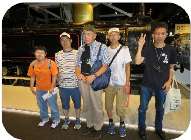
鉄道博物館 SL 機関車の前で

「きょうされん第46回全国大会in埼玉」に 参加のため 埼玉大宮へ行って来ました。 一番の思い出は、みんなで行った金鉄道博物館 です。 いろんな車しょうが展示されていたので とてもカッコよかったです。 おみやげも買ったのでうれしかったです。 またみんなで「松本会」があったら行ってみたい。 明日葉 佐々木有砂