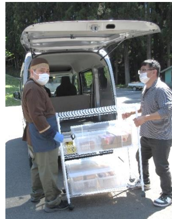
▲販売の準備中です

これからも様々なことに一喜一憂することだと思いますが悪化しない様に努めていきたいと思ひます。