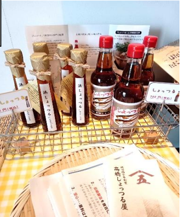
“しよつる”は万能調味料です Bon caféでも販売をしております!!