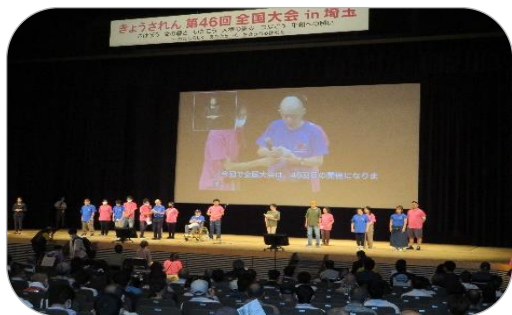
←オープニング セレモニーの様子

昨年に引き続き、今年も心配されるコロナ禍でしたが対面で開催されました。一羊会からは、利用者5名、職員5名の計10名で参加してきました。