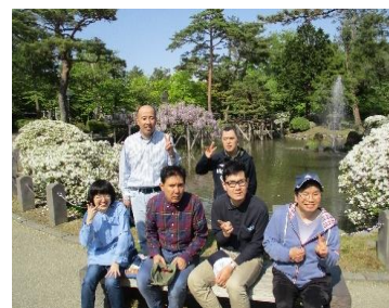
ツツジ、みどりの葉っぱと白い花がたくさんあったね