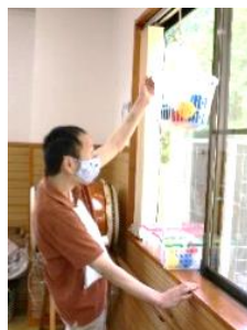
▲カラーボール玉入れ🎱