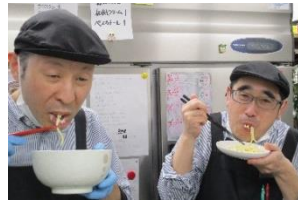
▲新作メニューを試食