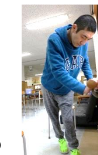
▼筋力トレーニング🏋️