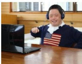
▲オハイエの動画鑑賞

今年度のストリームグループは利用者5名、職員3名でスタートしました。ストレッチや筋力トレーニング🏋️、足湯やドライブ🚗など前年度から継続した活動の他、好きなNHK番組や音楽の(ヘッドホン🎧を使用しての)動画鑑賞📺やカラーボール玉入れ🎱ゲームにも新たに取り組めました。残念ながら2名のメンバーが離れてしまいましたが、アップタイム活動を通して身体を動かして機能維持すること、心のリフレッシュにつながるような活動ができたと思います。