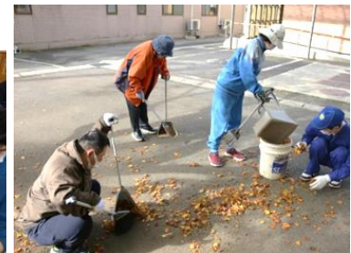
▲グループメンバー総出の落ち葉清掃