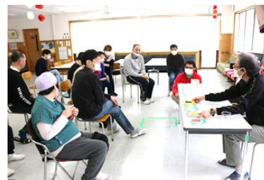
▲お店へ行った際のマナーの講習