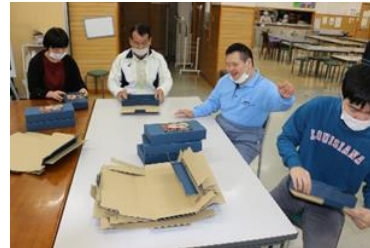
▲化粧箱組立てをして、指先運動

ガーデングループは室外の環境整備を中心に活動を行ってきました。主に敷地内の清掃や花苗の販売に力を入れてきました。気温や天候に左右されることもたくさんありましたが、みんなで協力して最後まで取り組むことができました。今年は雨天時に室内で体操や指先を使った活動と、日常生活に必要なマナーなどについて学習しました。また、今年度も花苗をたくさん購入いただきありがとうございました。来年度も今まで以上に頑張って取り組んでいきますのでよろしくお祈りします。