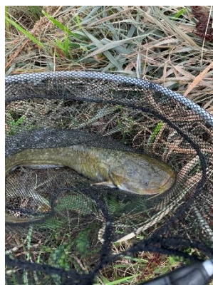
ぼくが釣ったナマズです♡