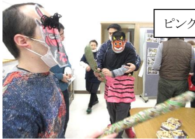
ピンクの鬼パンツ！！

今年の恵方は「南南東」。お昼は恵方巻きを丸かぶり。 午後は豆まきで福を呼び込みました！！ 今年も1年良い年になりますように。