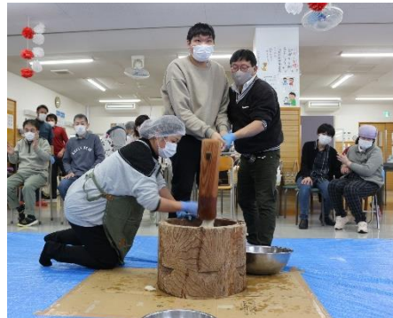
▲ 卯年の年男による“もちつき” ▲