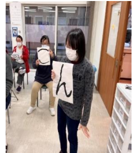
▲ リモートでも盛り上がりました！！ ▲ 『もちぺったんこ』 『ヨイショ』