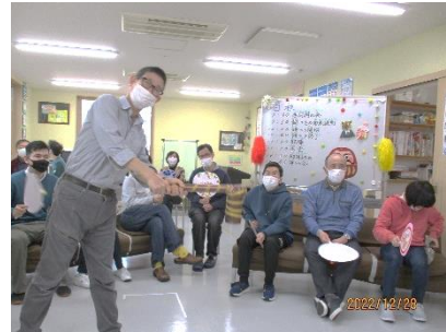
▲ リモートもちつきも負けずに大盛り上がり\(^o^)/ ▲