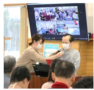
▲ 御用納め みなさんお疲れ様でした