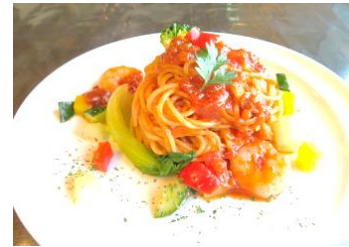
▲冷製ペスカトーレ