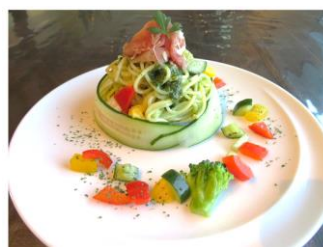
▲冷製ジェノベーゼ

冷製ペスカトーレは、初めて食べたときに、ふつうのペスカトーレより具たくさんでおいしいし、もりつけがとてもきれいだなと思いました。夏はあつくて大変ですが、このつめたいパスタは大好きなので、皆さんも一度食べてみてはいかがでしょうか?ねだんは各960円。期間限定です。